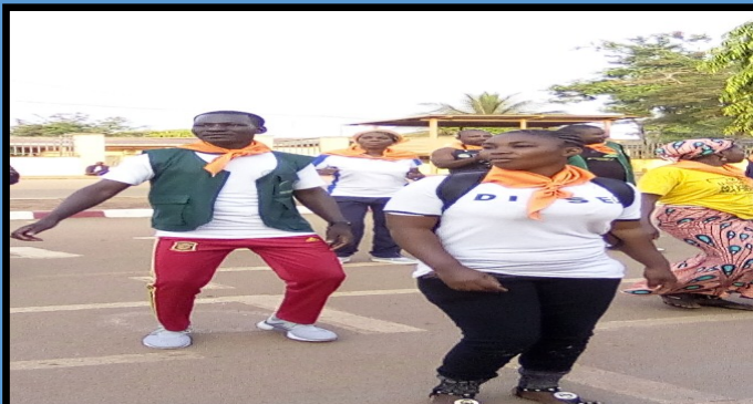
Activités sur les 16 jours d'activismes contre les VBG