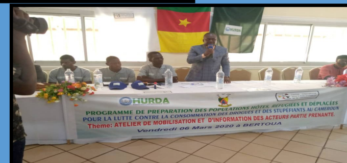
Activité de lutte contre la consommation des drogues.