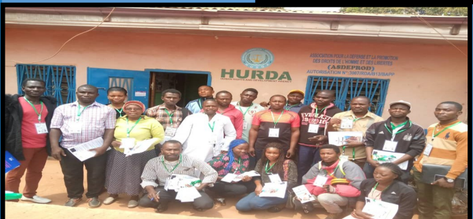
Accréditée lors du double scrutin du 09 février 2020