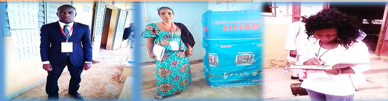
OBSERVATEUR ASDEPROD EXTREME - NORD