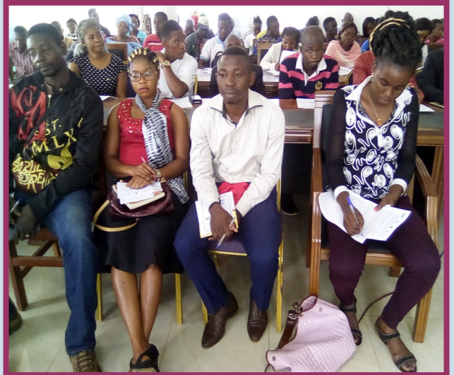
Formation en droit de l'Homme avec le CNUDDH-AC à LA Marie de Bertoua 1er.