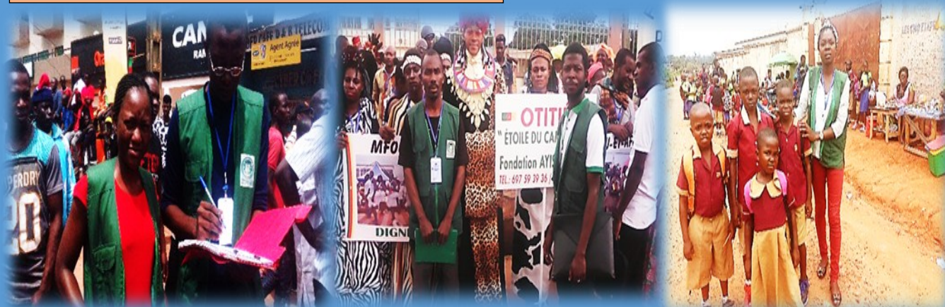
GREVE DE L'ELECTRICITE A BERTOUA