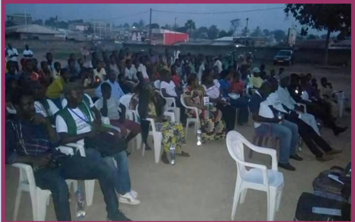
Causeries éducatives et sensibilisations