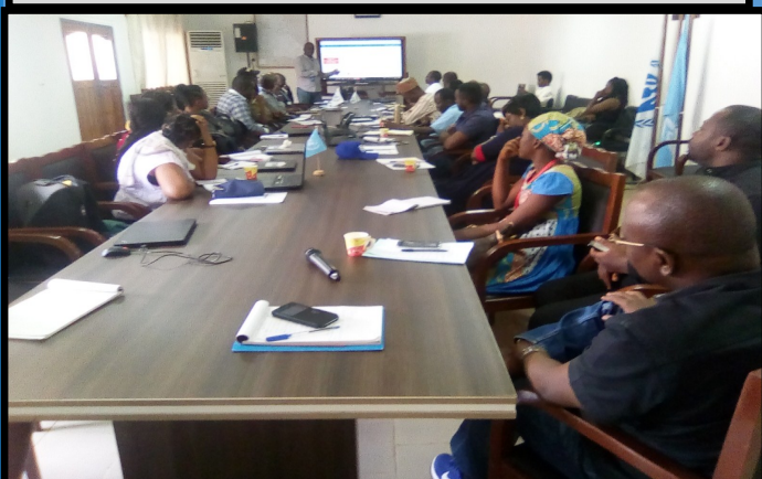
Plate forme d'enregistrement des organisations avec OCHA