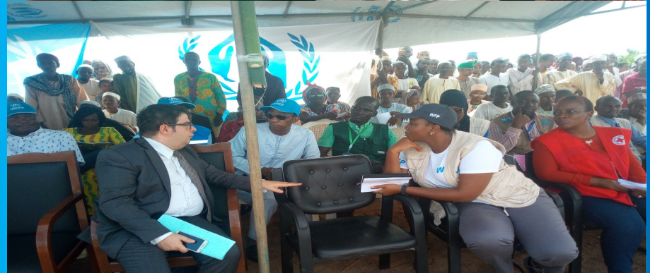
L'AIDE D'URGENCE AUX SINISTRÉS DE GIWA YANGAMO A L'EST CAMEROUN PAR L' AMBASSADRICE DE TURQUIE 2019.