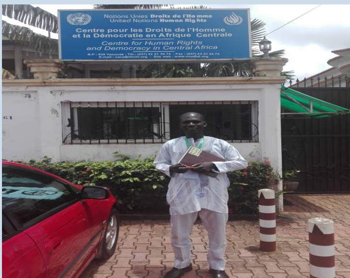
Participation au séminaire portant sur les droits de l'Homme Au CNUDDH-AC siège de YAOUNDE .