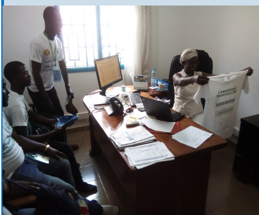
Coopération avec l'UNHCR-BERTOUA

Images de coopération avec divers partenaires humanitaires