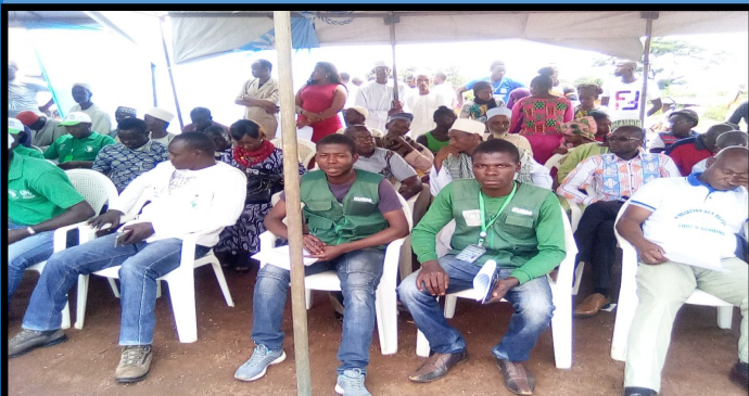
Journée mondiale du réfugié à Tongo-Gandima