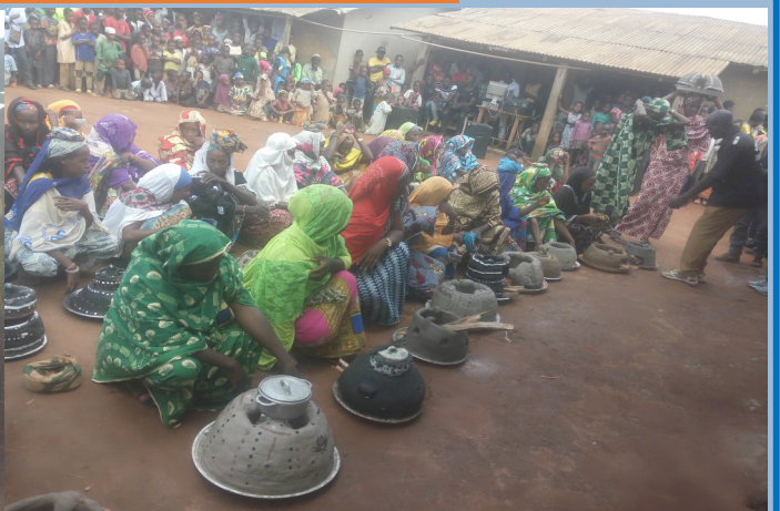
HURDA participe aussi aux projets de l'Environnement, la lutte contre le réchauffement climatique.