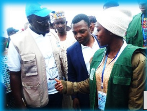
ASDEPROD – PLATEFORME OSC -EST