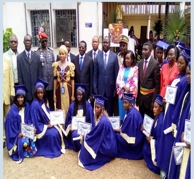
Sortie officielle de 50 filles au CPFF de Bertoua