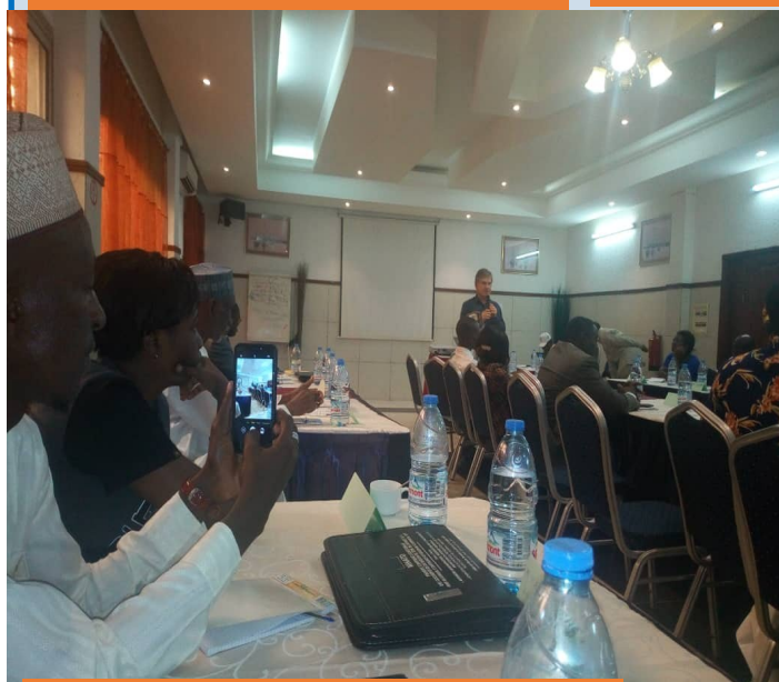
Coopération HURDA / Union Européenne