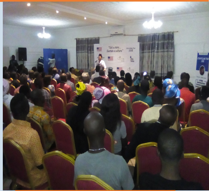
HURDA / AMBASSADE DES ETATS -UNIS.