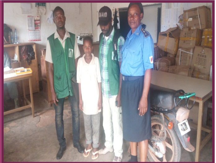
Volet protection de l'enfant réfugié (Mandjou)