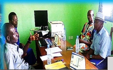
ASDEPROD – RAYON DE SOLEIL