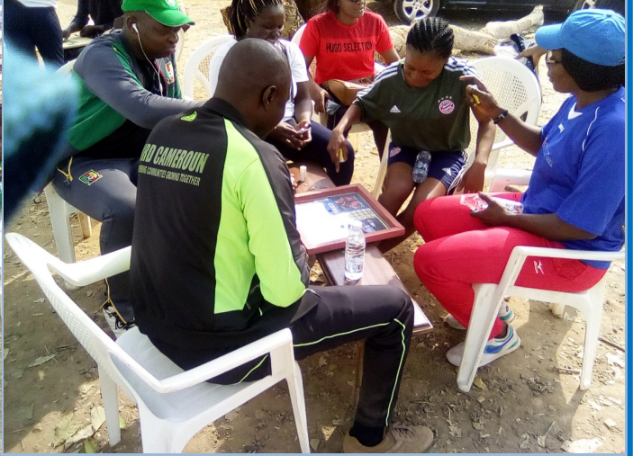
En prélude de la journée internationale des réfugiés et la clôture des activités humanitaires fin d'année 2018.