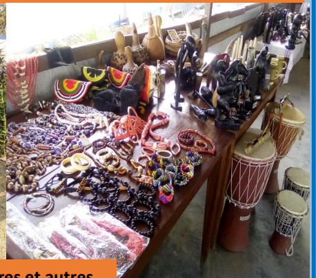
Journée de la culture avec tous les partenaires humanitaires et autres .