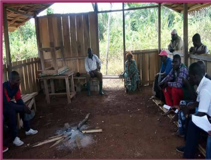
Question d'état civil au village Gbakombo