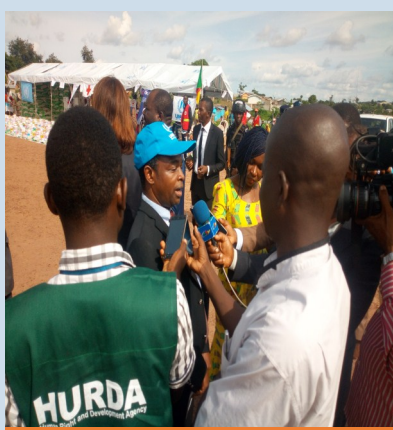
À l'occasion de la visite de travail de l'ambassadrice de TURQUIE à guiwa