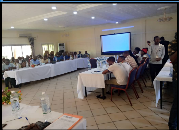
Lancement de la campagne de sensibilisation de mobilisation de lutte contre la consommation des drogues et stupéfiants en milieux jeunes et scolaires au Cameroun le 06/03/2020.