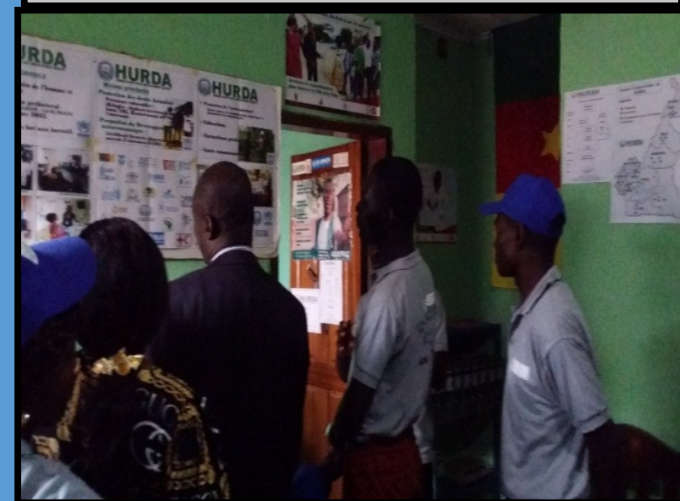
L'inspection des experts du MINAT du 12 au 13 MARS 2020 dans les locaux de HURDA .