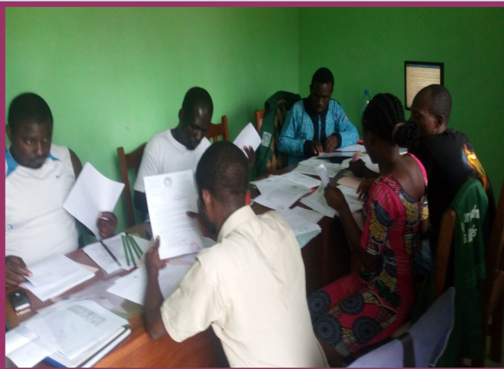
Renforcement de capacité en montage de projet dans les locaux de HURDA.

Régulièrement ,sont organisées des séances de renforcements de capacités au sein de la structure HURDA, la participation des séminaires, des forums, des ateliers et plates formes, des référencements des cas de VBG à la pratique de l'autonomisation à travers l' apprentissage des métiers tels que (la couture, l'hôtellerie, l'informatique, la décoration, les activités génératrices de revenus (AGR) ) dans les centres agréés Bertoua-Dimako.